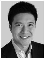
衆議院議員 村越ひろたみ

■1974年市川生まれ(37歳)。■昭和学院小、市川中学、市川高校、青山学院大学国際政治経済学部卒業。コンピューターハードウェアメーカー勤務を経て、早稲田大学大学院法学研究科に進む。■在学中に、千葉県議会議員に初当選。2003年11月の衆議院選挙で29歳で初当選。2005年総選挙で惜敗するも、政権交代を実現した2009年8月の総選挙で127,588票を獲得、国政に復帰。■現在、予算委員会委員、外務委員会理事。「死刑廃止を推進する議員連盟」事務局長。